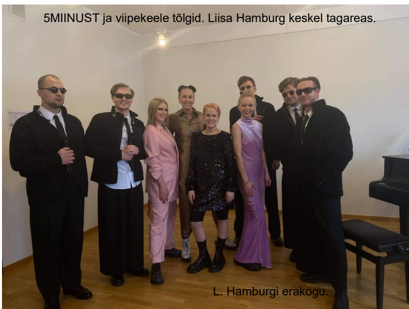
L. Hamburgi erakogu.