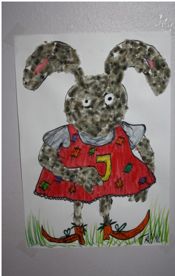
Tänases lehes näete algklassiõpilaste töid.

Veebruaris uurisin kaasõpilastelt, mida peaks tüdruk teadma ja tegema, et poisitele meeldida. Selgus, et sellele küsimusele pole üldsegi lihtne vastata. Arvatakse, et poisitele meeldivad nn pahad tüdrukud - tegelikkuses on aga asi hoopis teistsugune.