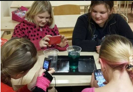
Oma meistriteoset tuleb kohe piltka emaile saata.