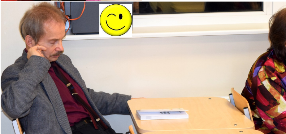
Ka õpetajatel olid tunnid, ainult et harjumatul ajal.