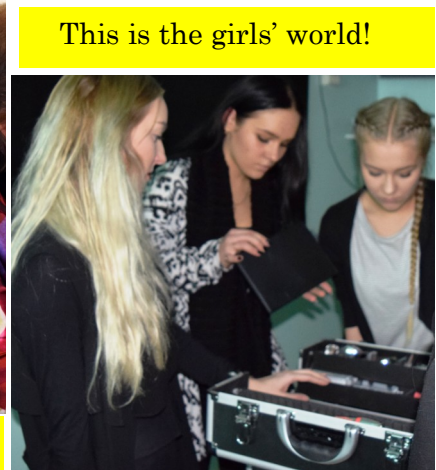
This is the girls' world!