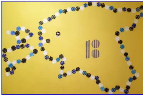
Algklasside kaunis käsitöö kodumaa sünnipäevaks

Uksed võiksid ise lahti minna. Toolid hõljuvad klassis ringi. Klassi pääsemiseks on vaja erilist kaart. Koolis on piljard, puuetundlik tahvel, robotkoid ja robotkoristajad.