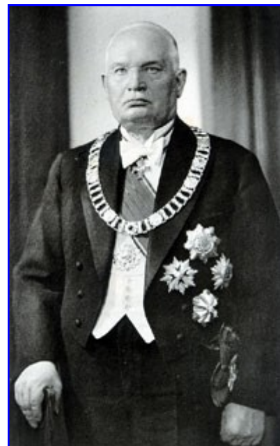
Eesti Vabariigi esimene president Konstantin Päts sündis 23. veebruaril 1874. aastal ja suri 18. jaanuaril 1956. aastal.