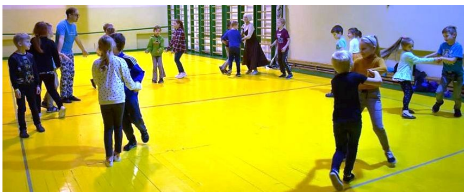
Hegerti tantsutund ja jäätisepulkadest meisterdatud pildiraamid. Fotod kooli FB lehelt.