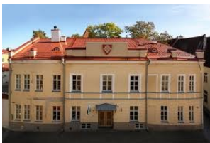
VHK https:// info.haridus.ee/ asutus/1312

„Kümne- dikke on meil umbes 150, õpilasi üldse kokku 988“