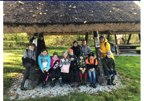
3. klassi tegemised