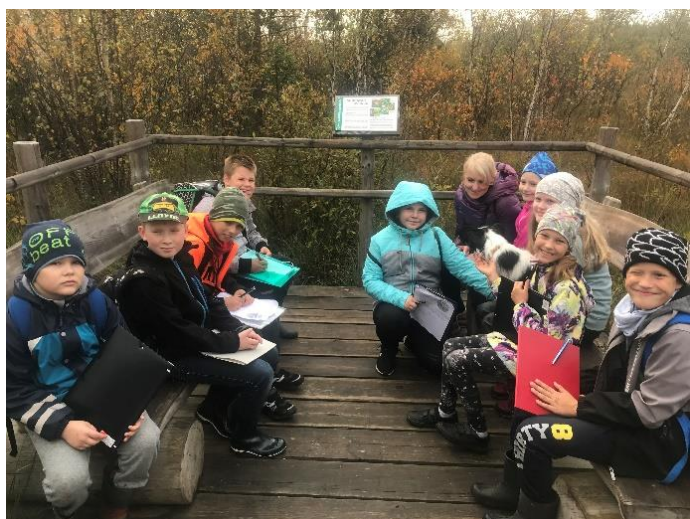
Sügisel Marimetsa rabas

Tahan tänada oma lapsevanemaid, kes on alati nõu ja jõuga abiks. Mul on väga vedanud. Ilusat suvevaheaega kõigile! Puhake, magage kaua, lugege, õppige midagi uut, nautige suve ☺