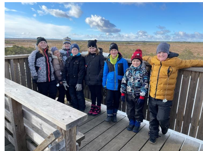
Talvel Marimetsa rabas