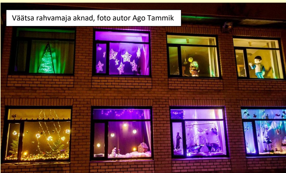
Väätsa rahvamaja aknad

Siin tekkis mõte, et miks ei võiks meiegi koolis jõulude eel kaunistada alumise korruse aknad - kutsuda appi lapsevanemaid ja teisi täiskasvanuid. Vähemalt 25 akent võiks niimoodi ära kaunistada. Oleks endal ilus vaadata ja teistelgi põnev vaatama tulla. Mai Jõevee